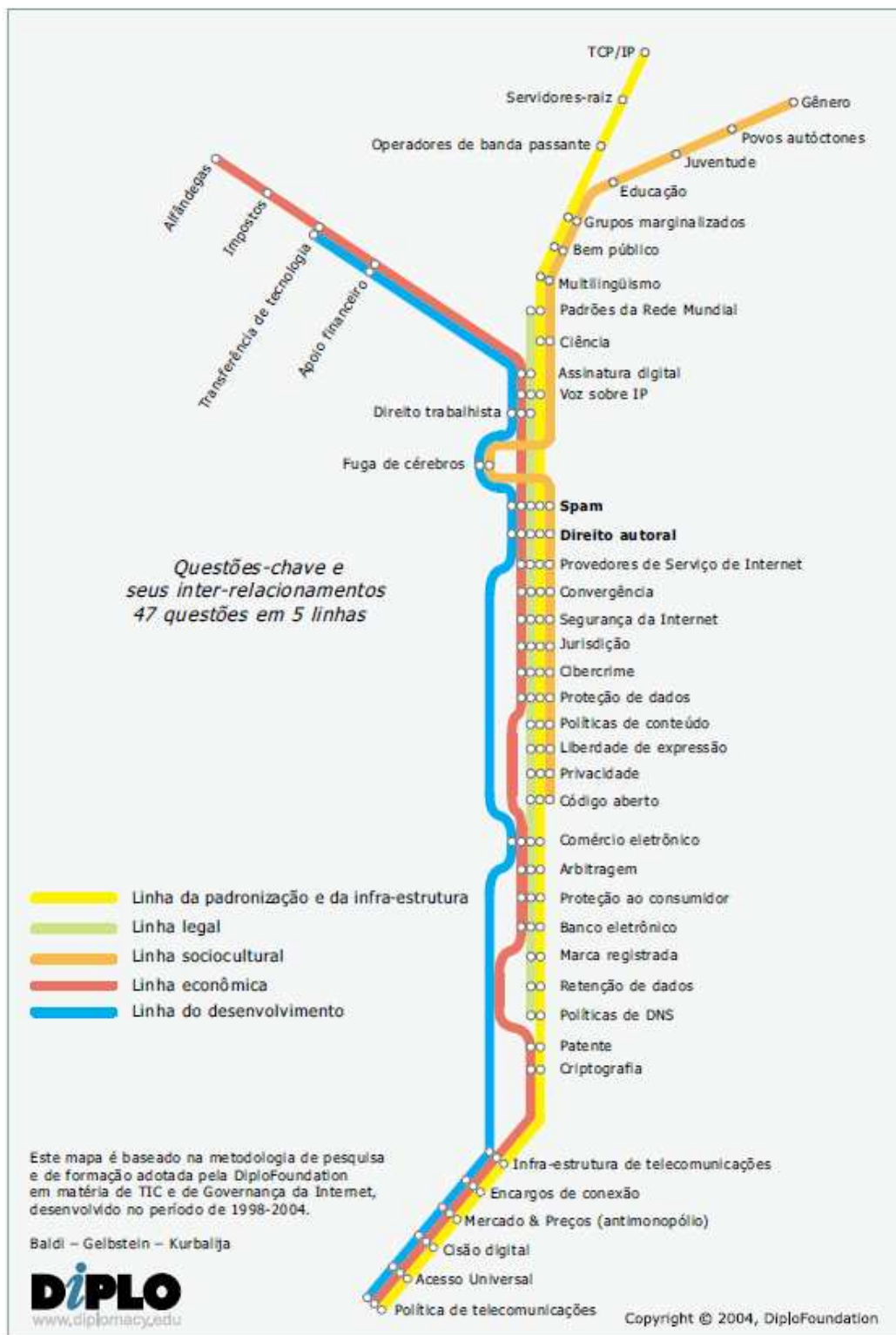
Figura 2.2 – Representação das linhas de trabalho, de questões-chave e das áreas relacionadas à Tecnologia da Informação e Comunicação (TIC) e Governança da Internet – 2004